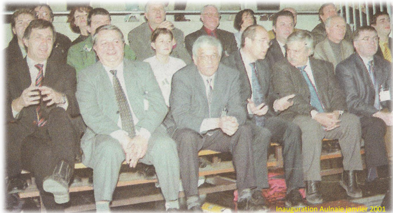
Inauguration Aulnaie janvier 2001