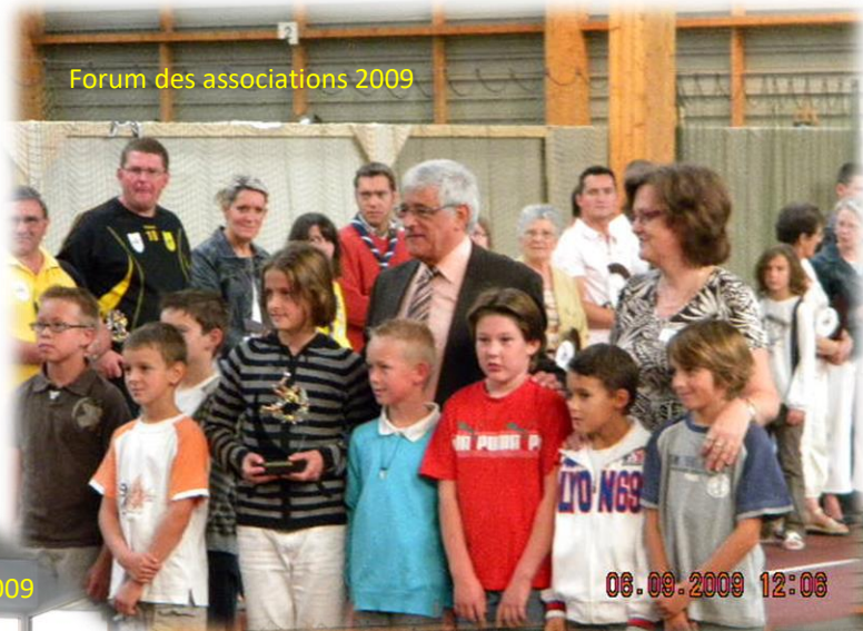
Forum des associations 2009