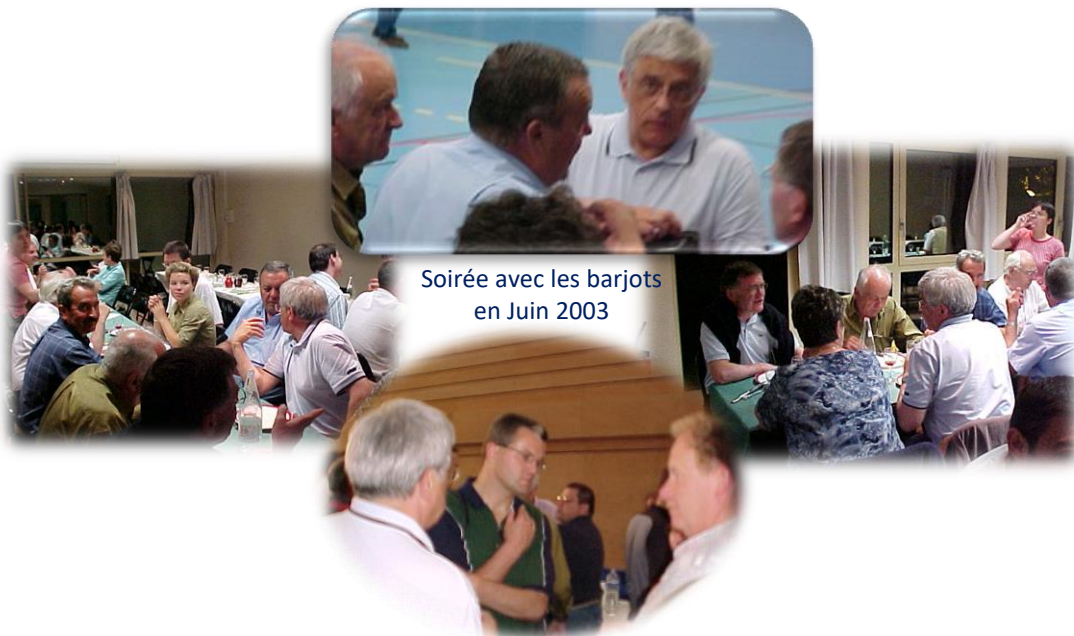
Soirée avec les barjots en Juin 2003