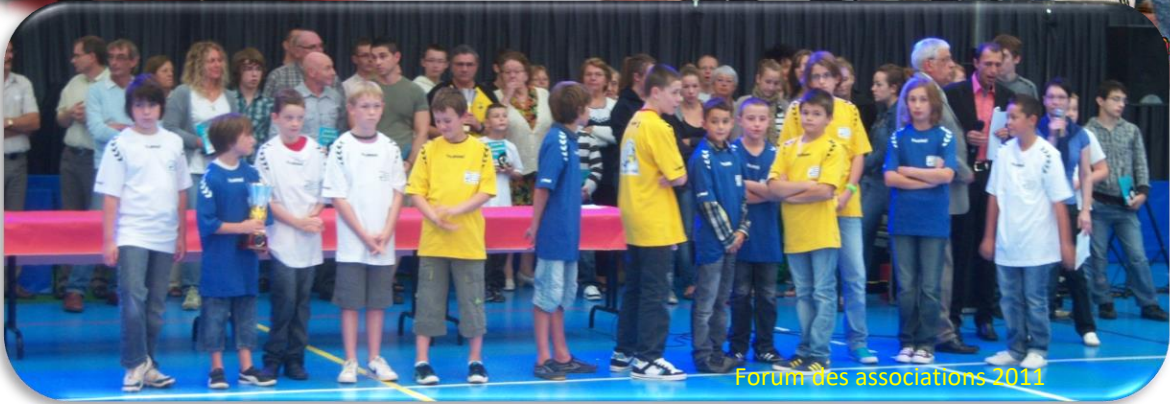
Forum des associations 2011