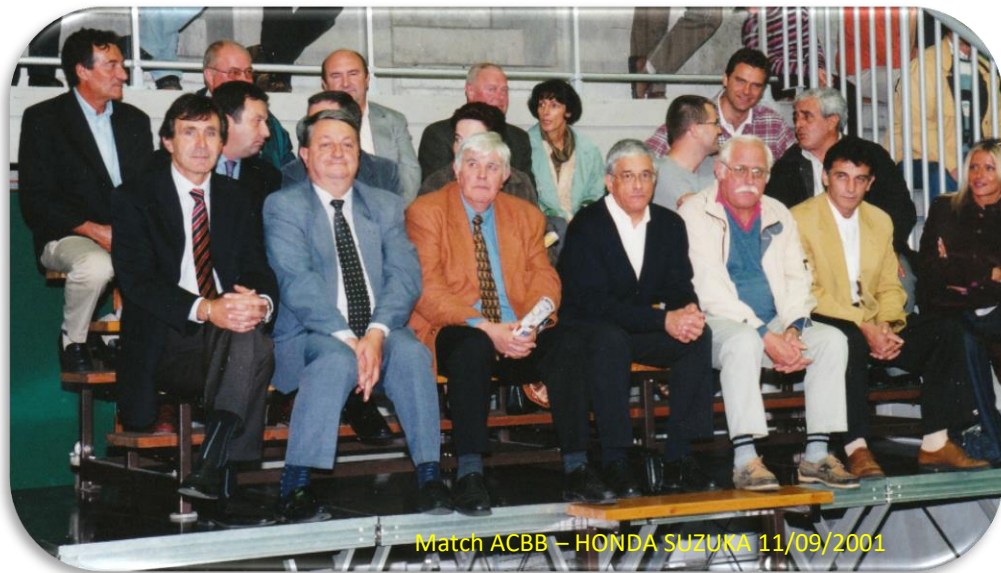
Match ACBB – HONDA SUZUKA 11/09/2001